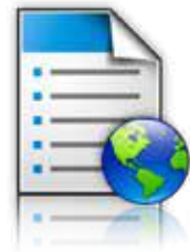
Formularios y Favoritos

Personalización de la pantalla: Muestre una presentación personalizada y con función de desplazamiento en la pantalla táctil color para comunicar mensajes importantes a los usuarios mientras la impresora está en modo de ahorro de energía.