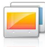
Personalización de la pantalla